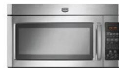
FOUR À MICRO-ONDES