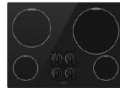
TABLE DE CUISSON