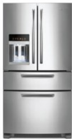
RÉFRIGÉRATEUR 1 ou 2 portes

5. Inscrivez les dimensions des appareils ménagers que vous conservez. Pour vos nouveaux appareils, demandez les fiches techniques à votre fournisseur.